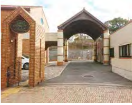
下関市子ども発達センター

問 発達障がいに関する相談件数は、令和元年度は7047件、2年度は8249件、3年度は9951件である。 答 1歳6か月児健康診査、3歳児健康診査、5歳児相談会に対応している。 問 早期発見、早期療育への取り組みは。 答 下関市子ども発達センター(幡生本町)において、発達支援事業に従事する専門職の人数は。 答 作業療法士3人、臨床心理士2人、言語聴覚士1人、言語指導員1人、理学療法士1人が従事している。支援者養成の現状は。 問 保育所や幼稚園などの職員に対し、ティーチャーズトレーニングを3カ所まで198人を対象に実施した。発達障がいの診断までの期間は、子ども発達センター診療所では約2カ月である。 ※多文化共生についても質問