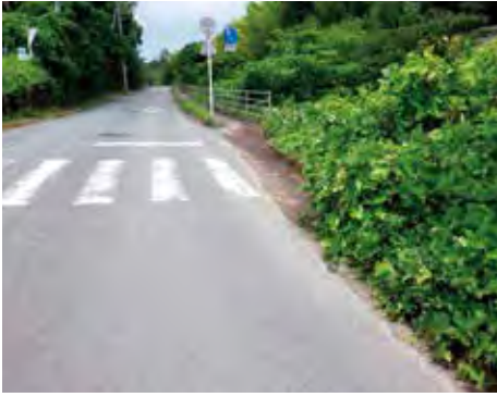
通学路に繁茂した雑草

問 本庁・菊川・豊田・豊浦・豊北地区における市道の除草にかかる令和4年度の予算は。 答 本庁地区が約4200万円、道路の陥没補修や側溝修繕などの道路維持費の約3分の1を占めている。各総合支所管内では、菊川が約20万円、豊田が約110万円、豊浦が約100万円、豊北が約60万円となっている。 問 通学路などは除草の要望も多く、予算不足が懸念される。除草に比べて費用が抑えられる防草という手法があるが、本市での導入状況は。 答 特に除草に時間と費用がかかる通学路や急傾斜地などについては、令和4年度から防草シートや張りコンクリートなど、除草が不要となる防草工事を行っている。今後も現場に合った効果的な雑草対策を実施しながら、将来的な維持管理費の軽減を図っていく。 ※自分専用水道、買物難民・買物弱者への対応などについても質問