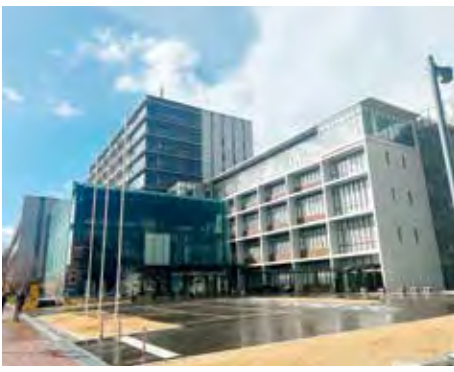
財政健全化に取り組む下関市

問 財政健全化に向けた取組状況は。 答 職員数は令和2年度から令和4年度までで115人を削減し、給料・職員手当、組織の見直しにより、人件費の縮減額は、令和3年度までの目標を上回っている。また、公共施設マネジメントは、適正配置の推進や各施設の運営方法の見直しが行われており、令和16年度までに30%の削減に向けて取り組んでいる。 問 新たな収入確保・財源の創出は。 答 令和4年度9月補正で、ポートレース事業会計から120億円を受け入れ、同額を基金に積み立てた。令和3年度はネーミングライツで約1500万円、ふるさと納税で約5億円の収入があった。 問 今後の見直しは。 答 職員数はさらに76人を削減予定、一般財源の規模は令和7年度当初予算で令和元年度対比22億円の削減、財政調整基金残高は70億円、一般会計市債残高は73億円を目指す。