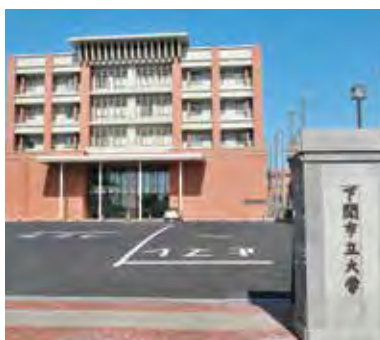
データサイエンス学部(仮称)を設置予定の下関市立大学

市が出資をしている法人について、現在の課題や今後の展開などについて調査を行いました。ここでは、主な法人について、委員会においてなされた意見や要望などを紹介します。 ▼下関海洋科学アカデミー 管理運営している海響館に対し、海峽エリアビジョンへの積極的な参画を求め、さらなる集客増となる取組を期待する意見がありました。 ▼下関市立大学 データサイエンス学部(仮称)の設置に当たり、学ぶ内容などの周知を図り、子供たちの将来の選択肢の一つとなるよう、認知度の向上に努めてほしいとの要望がありました。 ▼下関市立市民病院 新型コロナウイルス感染症の重点医療機関として、大きな役割を果たしているが、現場スタッフの精神的・肉体的ケアにも心を配るよう要望しました。