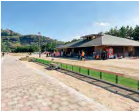
ひこつとらんどマリナービーチ

問 近年の海水浴による水難事故の件数とその概要は。 答 潜水業務を開始した令和元年7月以降、令和2年は1件で、安岡海水浴場で幼児2人が安岡漁港の防波堤付近まで流された。令和3年は2件で、安岡海水浴場で男性3人が浮き輪につかまり200mほど沖に流された。また、綾羅木海水浴場でも男性1人が浮き輪につかまり200mほど沖に流された。 問 安心して海水浴を楽しんでもらうために、今後はライフセーバーの配置は可能か。 答 今後、関係機関や団体と連携し意見交換を行いながら研究したい。 問 ひこつとらんどマリナービーチのスピーカーの修繕については。 答 令和4年7月にスピーカーの故障が判明したが、ひこつとらんどマリナービーチは、県の所管となるため、県へ修繕の要望をしている。 ※観光の広報についても質問