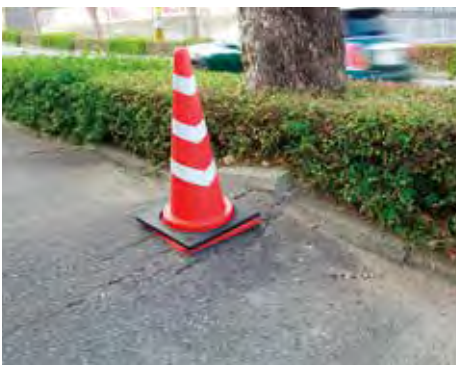
根の張り出しで支障が生じた箇所

問 市域公共交通再編実施計画に基づいてバス路線が分割され、乗り継ぎや割高な運賃が発生した。乗継運賃の割引は検討したのか。交通系ICカード利用者は乗り換えでも直通運賃と同額ですむようバス事業者に改善を求めるべきでは。 答 計画策定時にバス事業者と協議したが、路線数が多く路線網も複雑なため対応は困難だった。経過措置としてポイント付与などを行った。 問 安心して通行できる道路 問 道路の街路樹が歩行者の通行に支障となっている箇所がある。歩行者が安心して通行できるように適正な維持管理をすべきではないか。 答 街路樹の根が張り出し、舗装に段差が生じている箇所がある。保安措置や補修を行い、安全に通行できるように適切な維持管理に努めていく。 問 街路樹管理計画の策定はどうか。 答 策定していく方向で考えている。