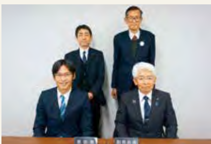
議会広報部会委員一同

議会だよりが市民の皆様親しく読んでいただけるよう、レイアウトや視覚障がい者への対応など広報機能の充実をテーマに1年間議論をしてまいりました。 現在のメンバーとしては、今号が最後の議会だよりとなりますがこの1年間の議論を次期広報部会に引き継ぎ、市民の皆様と議会をつなぐという議会だよりの使命を果たせるように努力してまいります。