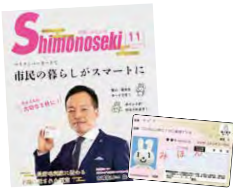
マイナンバーカードの普及促進

▼交付状況 問 令和4年1月現在の交付率は。 答 全国41・0%、山口県42・8%、中核市40・4%であるが、本市は、39・9%と少し遅れている状況である。 ▼総務省の普及促進に向けた取組 問 本市の取組は。 答 マイナンバー取得に向けた、サポートセンターの設置などでマイナンバーカードの普及促進を図っている。 問 マイナポイントの手続きはどこで行っているのか。 答 スマートフォン、パソコンのほか本市の窓口以外では、民間ショップ、郵便局で手続きを行っている。 ▼本市の今後における普及促進対策 問 他市が実施している、カード交付申請業務の委託についての見解は。 答 総務省が検討している、郵便局の行政事務拡大に向けた内容について研究していきたい。