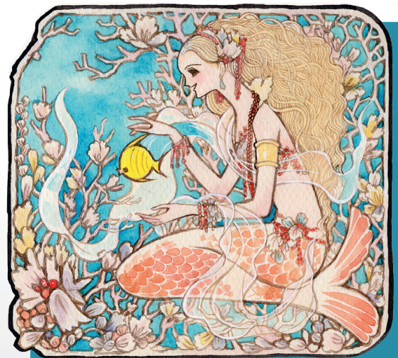
文月今日子《星座イラスト「うお座」》 (70年代の口絵イラスト)