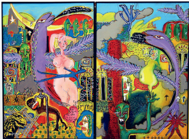
村岡真樹《By the light of day》2000年