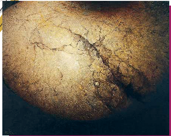
勝原実紀枝《宇宙へ翔ぶ 11.k》 第 66 回行動展（2011 年）行動美術賞