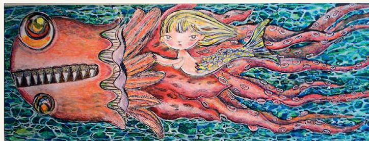
《子供の凱歌 ワダツミ》2017年