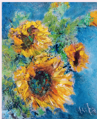
(左上から)《ひまわりA》2010年、 《巨過あたり》2010年、《りな1》 2018年