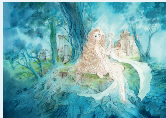
(上から) ファンタジーイラスト《青の森》2021年、猫の一家のイラストシリーズ《お昼寝》2019年