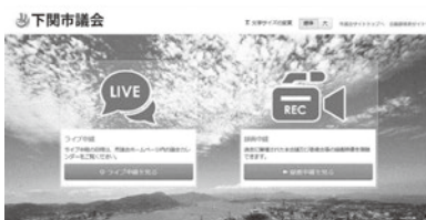
HP画面(ライブ・録画中継)

本会議や委員会の様子は、議場や委員会室での傍聴のほか、市議会HP「議会中継」でライブ中継や録画中継を閲覧できます。