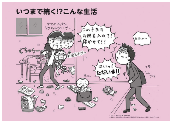
(公財)日本女性学習財団パネル「発見!ジェンダー」

今年は、ジェンダーやワーク・ライフ・バランスに関する内容のパネルを中心に展示しました。皆さんの関心が一番高かったのは…子育てと仕事の多忙な日々を描いた「いつまで続く!? こんな生活」でした。