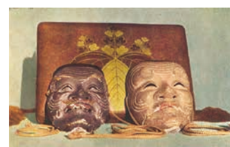
▲毛利秀元寄進の翁面 おきな と面囃 めんばち 。亀山能と共に継承され、市無形文化財に指定されています。

能楽に関心を持つ人が年々減少する中、子どもを能の舞台に起用したことがきっかけで平成22年から始まりました。現在、小学1年生から高校2年生まで、10人の子どもと大人も通っています。