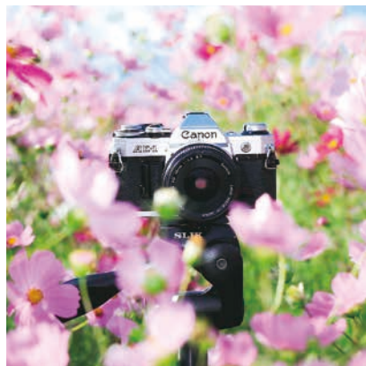
♡ Q ▼ @wanda_maruさん