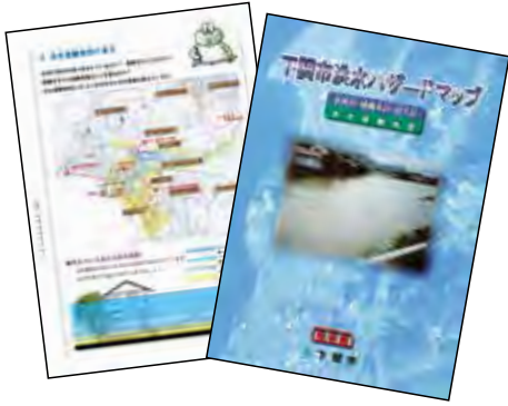
洪水浸水想定区域の見直し

問 千年に1度を想定した「ハザードマップ」の見直しが予定されていると聞くが、市の取り組みは。 答 綾羅木川、友田川、武久川、木屋川、田部川では、浸水想定区域の見直しが既に公表されており、現在ハザードマップの作成を進めているところで、令和3年3月末までに関係住民へのマップ配布をはじめとした周知を予定している。 問 若者人口の減少と高齢者人口の増加に対応する支援方法は。 答 平成24年度から防災士養成講座を実施しており、261名の方々が防災士として、避難訓練の支援などに取り組んでいる。今後もまちづくり協議会や自治会なども連携し、自主防災組織等の育成強化を図り、地域の防災力の向上に努めていく。 ※下水道管路網を利用したPCR検査システムへの取り組みの効果についても質問