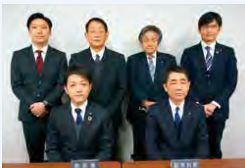
議会広報部会委員一同

今年度は、皆さんに、わかりやすい紙面の作成を目指して、表紙やレイアウトの変更に取り組んできました。次号から、新メンバーで編集することにありますが、引き続きしものせき議会だよりをよろしくお願ひします。