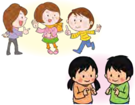
手話によるコミュニケーション

問 条例制定に向けた進捗状況は。 答 障がい者団体、福祉関係団体、学識経験者と行政関係者8名から構成される手話言語条例検討委員会を令和2年6月に設置。先進地の条例等を参考に市が策定した案をもとに、検討委員会における先進事例との比較検討や10月に行ったパブリックコメントの御意見等を踏まえ条例案を策定。今後、令和3年第1回定例会に提出し、4月1日からの条例施行を目指している。 問 制定後の取り組みは。 答 市報やホームページ等を活用するとともに、パンフレットやポスターを作成し、手話が言語であることを広く市民に周知し、ろう者や手話に対する理解の促進に努める。また、毎年度実施している手話奉仕員養成講習会に加え、新たに手話を理解し学べる機会の提供に取り組む。 ※農業振興、希望の街の実現についても質問