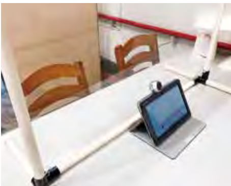
コロナ禍におけるリモート面会

▼事業と生活を守る支援策 問 景気回復とGDP上昇には、財政出動と個人消費を促すことが重要であると考えるが、その対応は。 答 市民の求めに応じて、全体のバランスを考えながら対応する。 問 内航旅客船事業者に対するコロナ対策支援は。 答 市内に本社を置く事業者がないため、対策支援は行っていない。 問 コロナの影響を大きく受けた公共交通への補助金については協議検討し、今後、補助金の見直しを検討するの。 答 検討する。 問 重症化率の高い施設に対するPCR検査に関して、令和3年度に向けた予算要求をしているの。 答 予算要求はしていない。 問 PCR検査の今後の取り組みは。 答 新型コロナウイルス感染症発生確認時には、「選択と集中」によって、迅速に検査を行っていく。