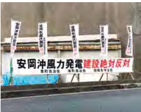
国道191号周辺の反対幟

問 現在の状況は。 答 前田建設工業は環境影響評価準備書に対する国の勧告を受け、環境影響調査を行っていたが、新型コロナウイルスの影響などから作業が中断している模様。 問 山口県の見解は。 答 県は一般海域占用許可基準を、令和2年10月に改正。公益上やむを得ない場合などを除き、条例による占用の許可はしないとしている。 問 計画は事実上不可能になったのか。 答 安岡沖が促進区域として指定されなければ計画の遂行は難しいと考える。 問 反対する会が提出した文書に対する前田建設工業の見解は。 答 政府が再生可能エネルギーの既存の制度について総点検することとしており、その動向を注視することのこと。 ※安岡地区複合施設整備事業についても質問