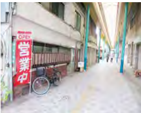
唐戸商店街(平日お昼時)

問 市の事業継続給付金の申請数、給付金額、市税滞納により給付対象外となった件数は。 答 令和2年12月11日時点の申請数は4339件、給付金額3億7690万円、市税滞納による給付対象外は245件である。 問 申請要件である市税滞納なしの基準日を、申請受付開始日の9月1日とするべきではないか。 答 国の緊急事態宣言が解除された5月14日から経済活動が徐々に再開されたことや、多くの方が納税の義務を果たしていることも踏まえて、6月1日を基準日としている。今後、基準日を改めることは考えていない。 問 飲食やスナックなど需要が大きく落ち込んでおり、年を越せても後が持たないため、さらなる経済支援が必要との声を聞いているがどうか。 答 感染拡大状況や国県他自治体の支援施策等を総合的に勘案し、新たな支援策等の必要性を判断していく。