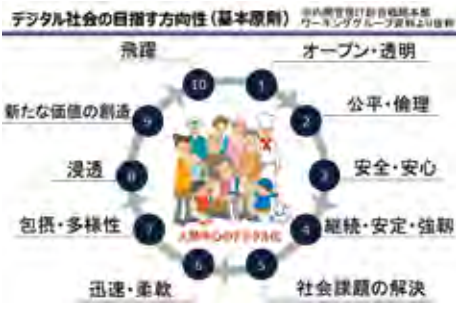
デジタル社会の目指す方向性

問 行政手続きのオンライン化の推進。行政手続きの押印廃止の進捗は。 答 全庁的に改めて見直し、速やかに実施できるように進めている。 ▼オンライン環境の充実 問 高度無線環境整備事業の状況は。 答 国の補助要件拡大により、旧4町や内日地区にエリアを広げ、できるだけ早期の実施に取り組む。 問 本庁と各支所のオンライン化は。業務用として光回線で結ばれているが、住民サービス向上のための活用について、今後検討をしていく。 ▼デジタル人材の育成 問 市立大学の改革や新学部設置と赤字批判についてどう考えるか。 答 教育は未来への投資で、そもそも赤字事業と捉えるべきではない。もちろん採算を考えずに作れば良いというものではないが、データサイエンスなど時代の要請と社会への貢献を考え改革を進めていきたい。 ※ウソカの農業被害についても質問