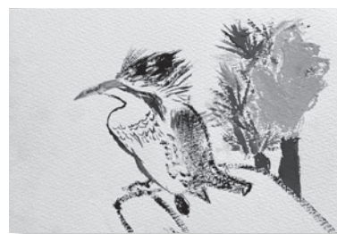
大好きなヤマセミ