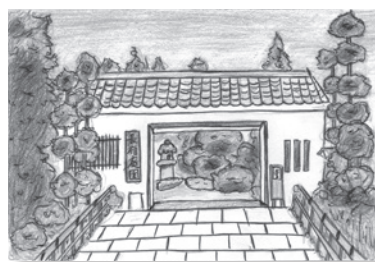
ワクワクする長府庭園の入り口