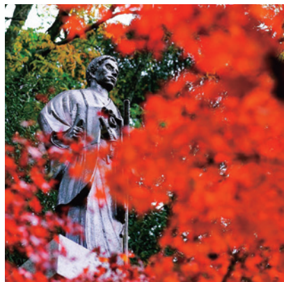
♡ Q ▼ @junjun_tioさん