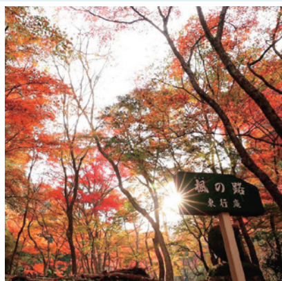
♡ Q ▼ @saru0112さん