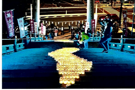
活動団体/関門海峡キャンドルナイト下関実行委員会