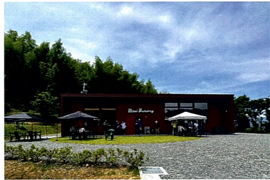
所有者/社会福祉法人内日福祉会 設計者/鈴木浩介建築設計事務所 施工者/金剛重機株式会社