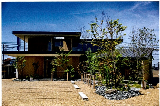
有限会社玉井工務店・株式会社TAD