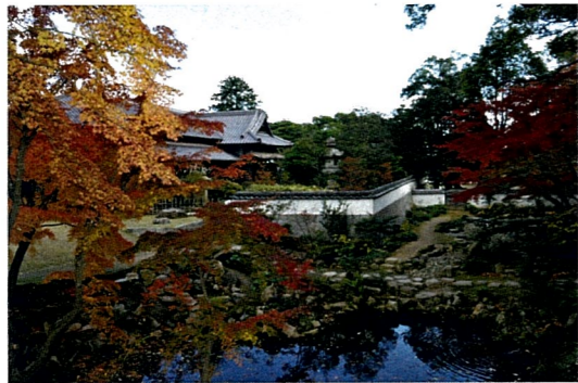
所有者/下関市観光施設課 施設管理者/一般財団法人 下関市公営施設管理公社