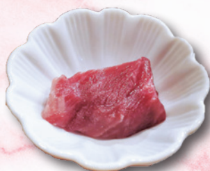
お店で尾の身をいただきました!