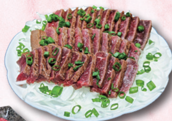
唐戸市場で買ってお刺身で!