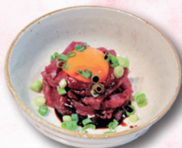
スーパーで見つけてユッケに!