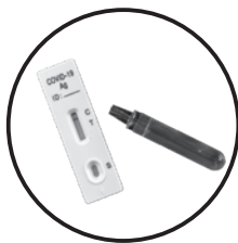
▲ 使用済 ウイルス検査キット

🔍 以下のごみは、赤色指定ごみ袋(燃やせるごみ)です! 青色指定ごみ袋に誤って混入しているケースが多く見られます。