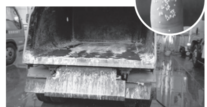
▲ ごみ収集車内で破裂したマイクロビーズ