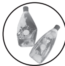
▲ 中身が残っている容器 ケチャップ、詰め替え用洗剤など