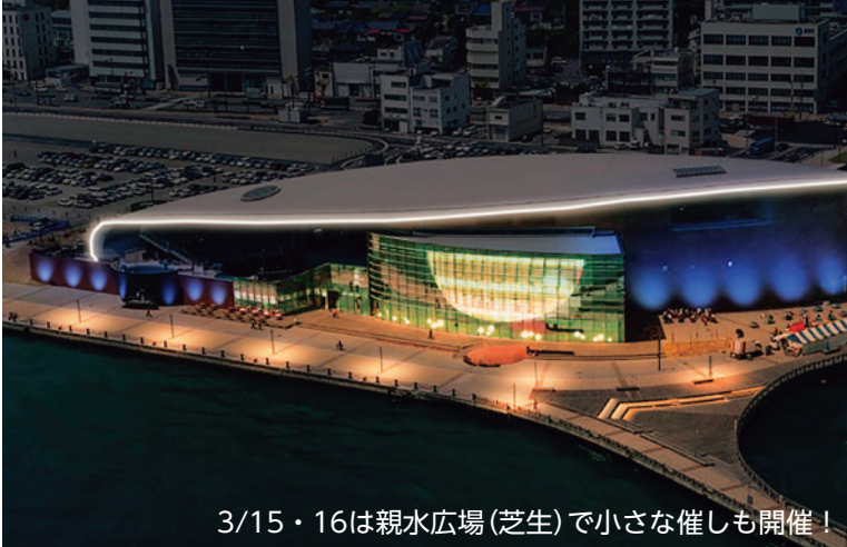
3/15・16は親水広場(芝生)で小さな催しも開催!