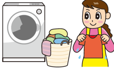
洗たくでよごれた水