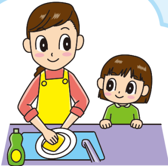
洗いものでよごれた水

わたしたちは毎日どのような時に水を使って、どのようなよごれた水を流しているでしょうか？