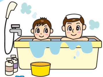
お風呂でよごれた水