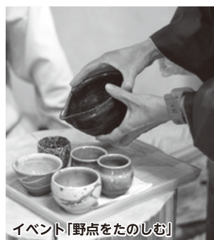
イベント「野点をたのしむ」