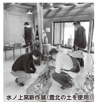
水ノ上製新作展(豊北の土を使用)