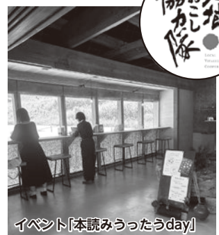
イベント「本読もうたうday」