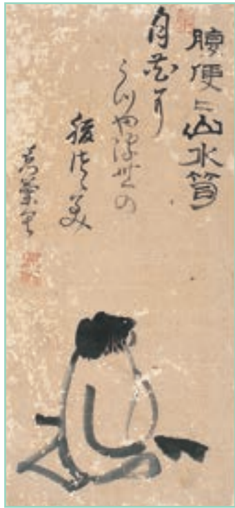
「月花に」句自画賛 弾琴図 美術館展示