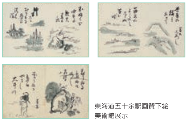
東海道五十余駅画賛下絵 美術館展示