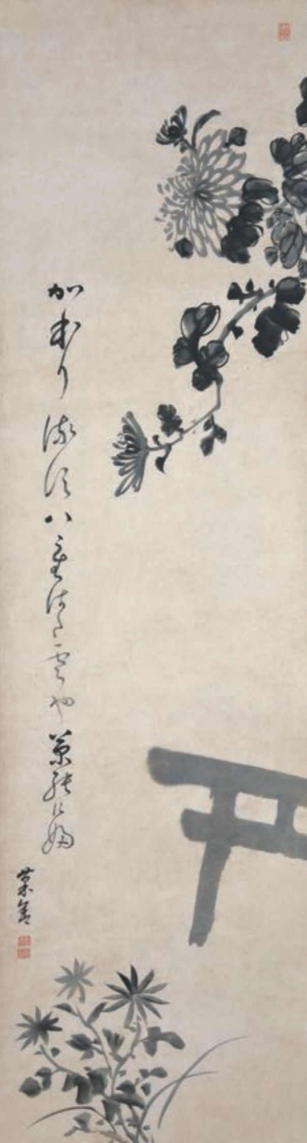
「かほり流す」句 自画賛 鳥居と菊図 個人蔵