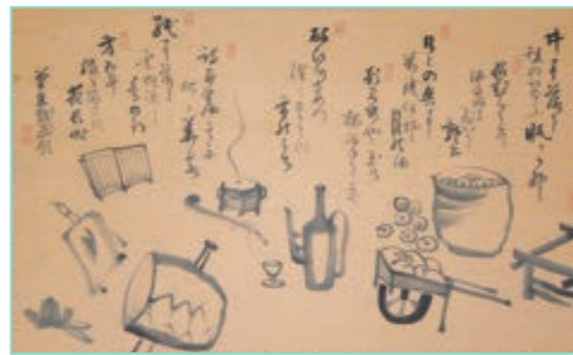
飲中八仙戯画 美術館展示