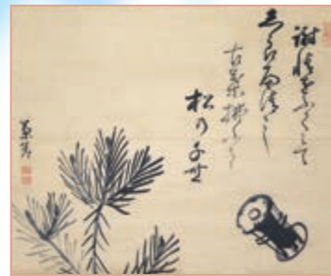
「しらべ清し」句自画賛 松と鼓図 歴史博物館展示