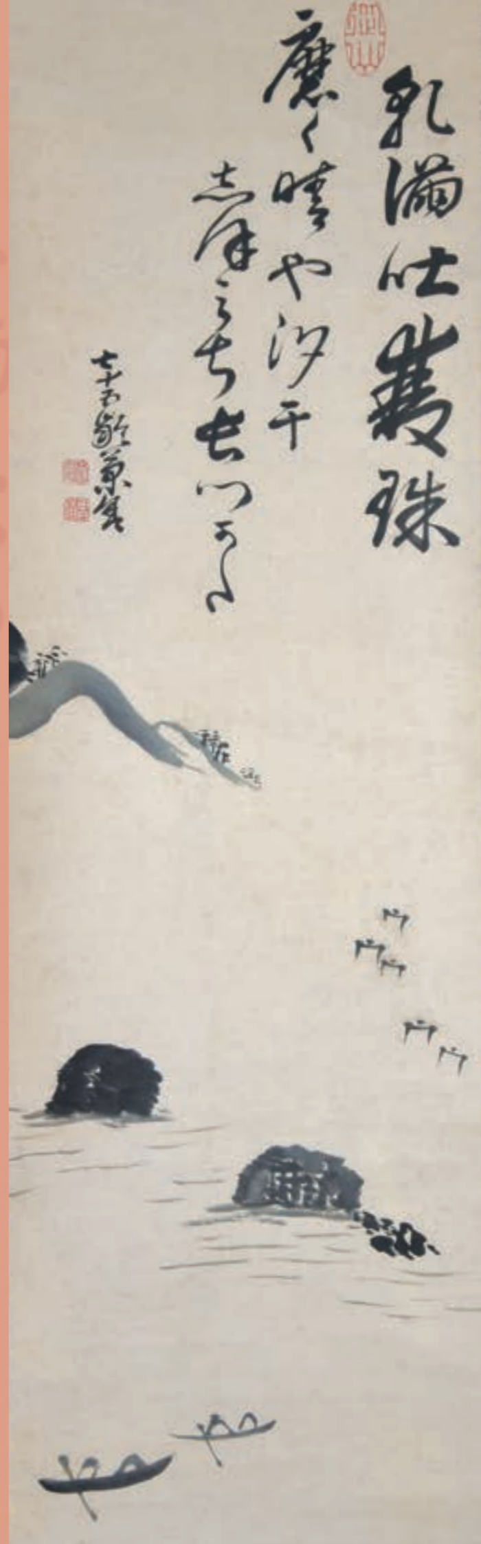
「磨く晴や」句 自画賛 干満二島図 個人蔵