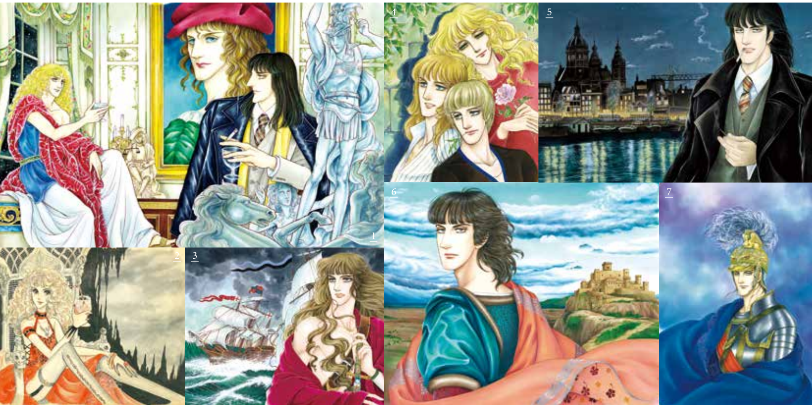
1.「エロイカより愛をこめて」『プリンセス』12月号（1979年） 2.「アップル・ハニー」『プリンセス』8月号（1975年） 3.「テンペスト」『月刊セブンティーン』7月号（1978年） 4.「イブの息子たち」『プリンセス』6月号（1979年） 5.「魔弾の射手」『プリンセス』8月号（1982年） 6.「アルカサル-王城-」『ビバプリンセス』12月25日号（1988年） 7.「プリンセスロマンドラックス ノルウェイブルーの夢」表紙用イラスト（1982年） ©Aoike Yasuko (Akitashoten) 秋田書店蔵

このたびの展覧会は、秋田書店が所蔵するカラー原稿から厳選した作品を中心に過去の展覧会では出品されなかったモノクロ原稿などをあわせ約300点の原画により構成します。青池保子の作品世界、その華麗で綿密なヴィジョンを堪能するまたとない機会です。