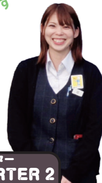
サポーター SUPPORTER 2