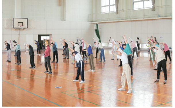
▲保健推進委員は、健康づくり教室や子育て交流会などを開催し、皆さんの健康づくりをお手伝いしています。

保健推進委員は、地域の健康づくりの推進役として、子どもからシニアまでニーズに応じたさまざまな健康教室を行っています。今回は、東部地区保健推進委員会が行う健康づくり教室にお邪魔しました。シニア層を対象としたロコモティブシンドローム予防の体操教室。皆さん1時間みっちり身体を動かしていましたよ。