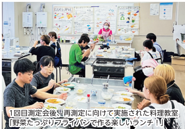
1回目測定会后、再測定に向けて実施された料理教室 「野菜たっぷりフライパンで作る楽しいランチ！」

生協に掛け合って、大学の 食堂で1日1個小鉢が無料になる 「ベジチェッカー優待券」を 考案しました！