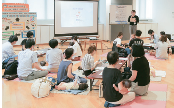
▲生活リズムや事故予防、メディアとの関わり方など、子育てのポイントについても紹介。

保護者同士が交流し、少しでも育児不安を解消して、安心して子育てができる地域づくりを目指しています。