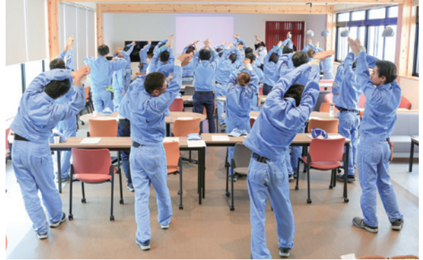
▲「食生活」「運動」「こころ」「ロコモティブシンドローム」など、幅広いテーマに応じて専門職がアドバイス。

睡眠時間の確保は絶対！ コンビニ中心だった 昼食は、副菜入りの 弁当にチェンジ！