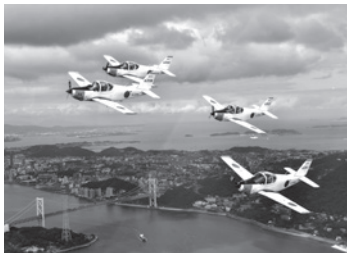
▲関門海峡上空を飛行する4機編隊(T-5)

海上自衛隊のパイロットを養成している小月航空基地に、たくさんの飛行機や乗り物が集結します!