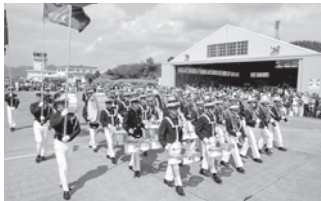
▲航空学生によるファンシードリル

※基地内への車両乗り入れはできません。公共交通機関をご利用ください。長府ゆめタウンと小月駅から基地との間で無料往復バスを運行予定です ※詳しくは小月航空基地HPで