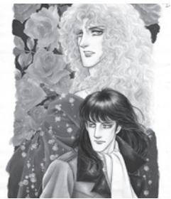
「エロイカより愛をこめて」 「プリンセス」11月号1980年 ©Aoiike Yasuko(Akitashoten)

期8月31日~10月14日 休月曜日 (9月16・23日、10月14日は開館) 因長府出身の漫画家、青池保子の原画約300点を展示します。 料一般1,400円(1,200円)、大学生1,200円(1,000円) ※( )内は平日料金