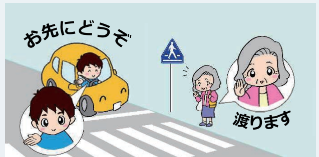
横断歩道ハンドサイン運動実施中