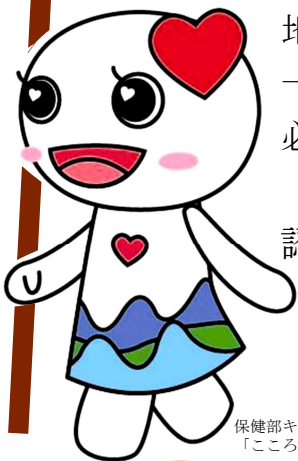
保健部キャラクター 「こころん」

※認知症サポーターは「なにか」特別なことをする人ではありません。 認知症について正しく理解し、偏見をもたず、認知症の人やその家族も 温かい目で見守る応援者です。