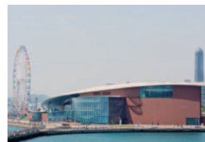
7 海響館(市立しものせき水族館)