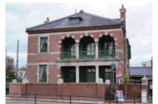
3 旧下関英国領事館