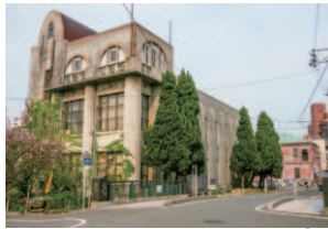
1 田中絹代ぶんか館