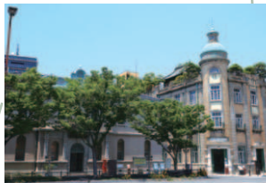
2 旧秋田商会ビル 下関南部町郵便局