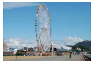
6 はい!からっと横丁