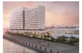
5 リンザーレ下関(2025冬)