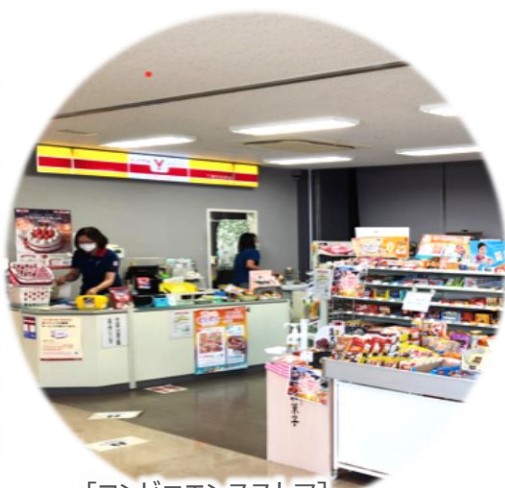
〔コンビニエンスストア〕

市役所本庁舎には、仕事の合間にホッと一息つけるいやしスポットがあります。束の間の休憩時間中はゆっくり一人で、時には職場の同僚と一緒に楽しくおしゃべりをしながら、癒されませんか？ここでは4か所のいやしスポットを紹介します。