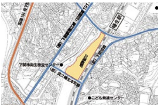
新病院建設予定地(基本計画案より)

答 条例を制定している他の自治体では、施策の基本方向や自治体の責務だけでなく、中小企業や住民などの役割などを規定している。そのため、本市が同様の条例を制定する際には、まずは商工団体などの関係機関の機運の醸成が必要と考えており、市としては、現在、中小企業の人材課題の解決に向けて取り組んでいる「地域の人事部」により、実効性を伴った条例制定への機運が高まることを期待している。