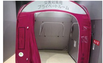
テント式のパーティション