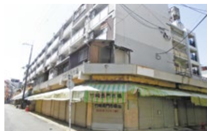
建替対象の竹崎改良住宅(3)・(4)棟