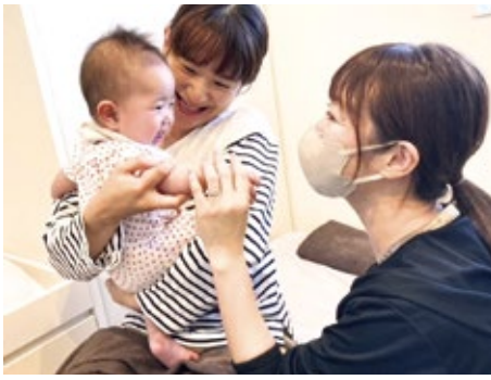
産後ママとベビーのためのケア事業

問 本事業に対する市長の思いは。答 利用料無償化と利用回数を拡大した。公明党市議の熱い要望に心動かされカタチにしたものだ。