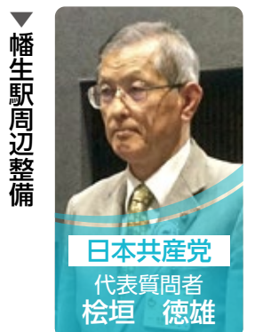
日本共産党 代表質問者 桧垣 徳雄