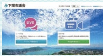
市議会ホームページ (ライブ中継・録画中継)