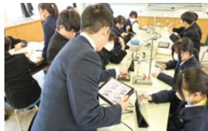
タブレットを使った授業