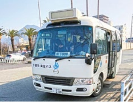
内日線の代替交通の実証運行バス

「トップアスリート」や「みらいアスリート」に認定し、支援金の交付、活動報告会の実施など、市民一体となって活躍を後押しする。