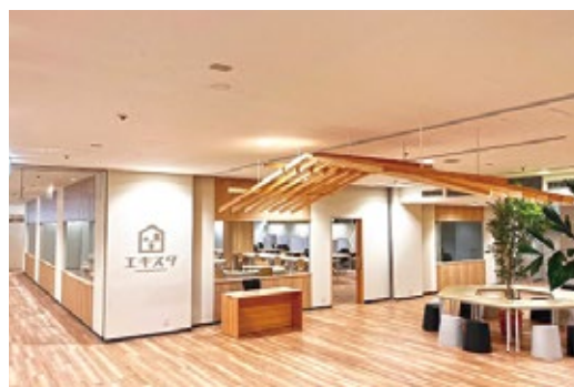
中・高校生等学習スペース「エキスタ」

問 「下関ふく」ブランドの競争力強化の取り組みは。 答 観光と食文化を一体で体験できるコンテンツの創出など、食のみならず高付加価値を提供する取り組みを業界と連携して進める。 ▼交流・にぎわい施策 問 関門海峡におけるジップライン可能性調査業務の背景と事業内容は。 答 実現性を改めて検証し、調査結果を踏まえ、次の展開を判断する。 問 下関陸上競技場施設整備事業について、施設整備の具体的内容と、活用方針については。 答 大型映像装置の設置や施設改修を進め、完成後は多目的スポーツ拠点として活用する。 ▼子ども・教育施策 問 安岡小学校の校舎増築事業の目的は。 答 教室不足解消のため校舎を増築し、令和9年4月に供用開始予定である。 問 玄洋中学校区の新しい学校づくりと複合施設整備の検討状況は。 答 玄洋中学校区で小中一貫校を令和9年に開校し、西山小学校跡地に複合施設整備を検討している。 問 新規学習スペース設置検討業務の取り組みは。 答 中・高校生などに対して快適な学びの場を提供するため、新下関駅周辺で学習スペースの候補地調査を行う。 問 下関市立大学大学院無償化事業