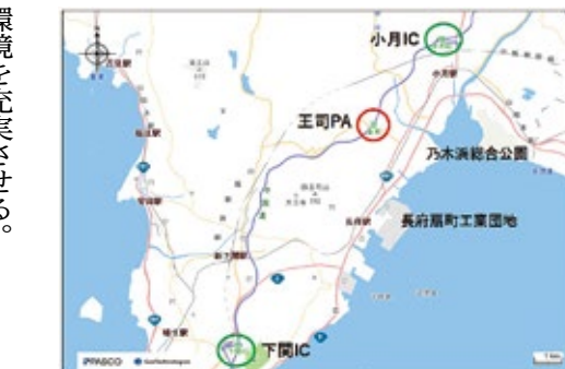
王司スマートインターチェンジ設置検討場所