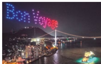
ドローンアートによるお見送り

答： 旅行者から大変好評であった。今後のクルーズ客船の誘致と港のにぎわい創出のための取り組みとして期待している。