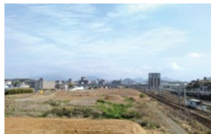
建設地の幡生操車場跡地