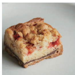
anbutter 果物のトレイバイク