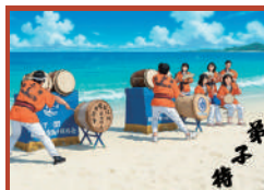
弟子待平家太鼓保存会