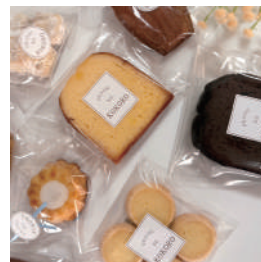
OKASHI NO KOKORO 焼き菓子