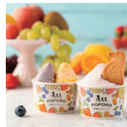
角島ジェラート ポポロ シェラート