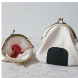
zakka7070 おにぎりがまぐち