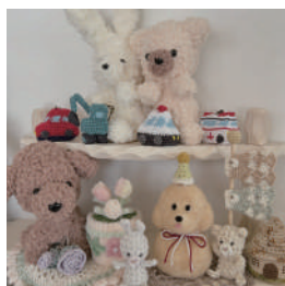
MAKANA 動物モチーフの雑貨