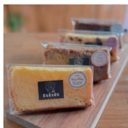
パンとおやつとくるる パン/シフォンケーキ