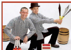
大道芸人シンクロシティ