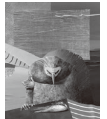
△堀晃(鳥への儀式)1981年

●所蔵品展 作品の「まわり」に目を向けてみたら / コレクションでみるシュルレアリスム 回7月12日(日)まで ●所蔵品展 夏休み特集「ようこそ! アニマル・ミュージアム」 回7月18日～8月23日 閩美術館(☎245-4131)