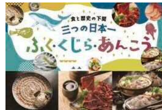
光がたなぐ、煌めく食と歴史の下関実行委員会