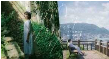
関門景観協会(下関市・北九州市)

気になるスポットを見つけて、「#関門シネマティックシティ」を付けてInstagramへ投稿してみませんか。