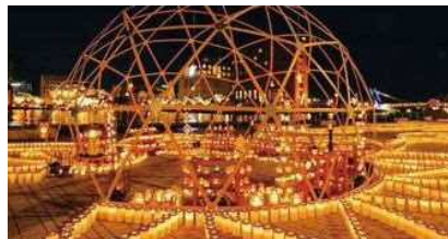
一般社団法人BASEMENT北九州