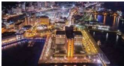
門司港レトロイルミネーション実行委員会