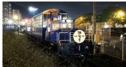
平成筑豊鉄道株門司港事業所