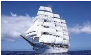
みなとオアシス門司港運営協議会