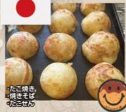
・たご焼き ・焼きそば ・たごせし