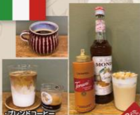
・ブレンドコーヒー ・カフェラテ ・キャラメルラテ