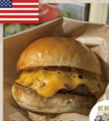
・プレミアムチーズバーガー