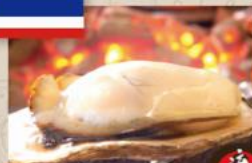
・スライシーなタイ風のタレで いただくシーフードBBQ