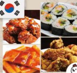
・国産の美味しい鶏肉を使用した マジミヨチキンが