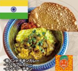
・南インドチキンカレー ・ベジタリアンカレー ・タンドリーチキン