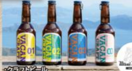
・クラフトビール