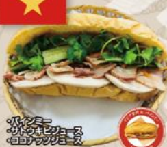
・ハインリッヒ ・ガトウキリ ・ココロアップメニュー