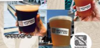
・クラフトビール