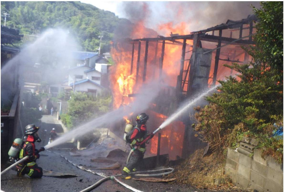
火災現場での活動状況