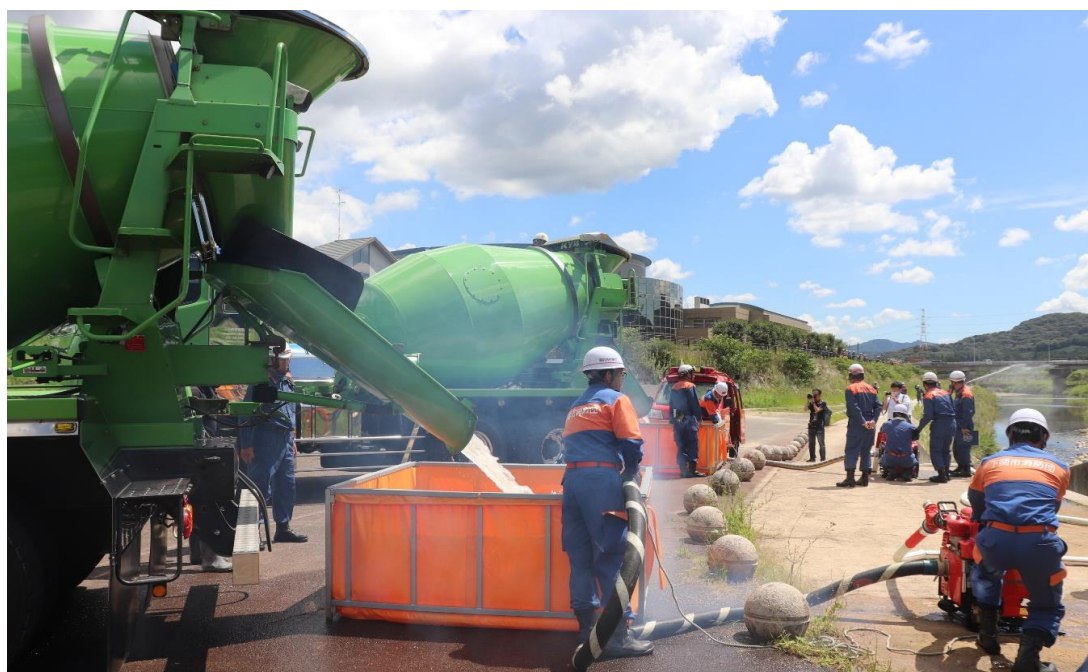
防災の日（関東大震災100年）に伴う防災訓練