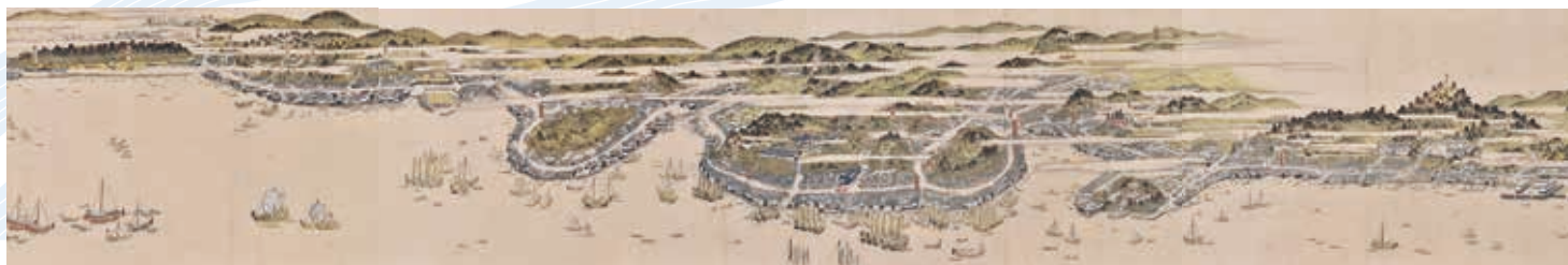
伝狩野晴筆 赤間関絵図(個人蔵/当館寄託)