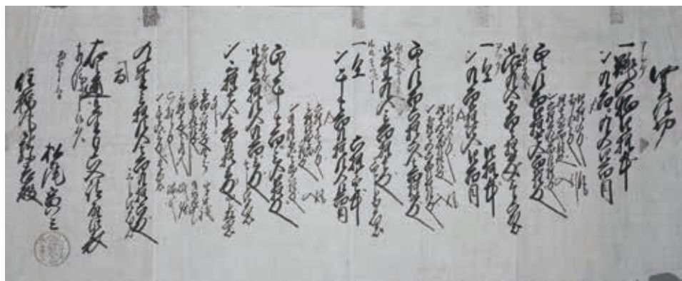
買仕切 小林家文書(当館蔵)