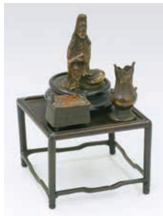
高杉晋作持仏(個人蔵/当館寄託)