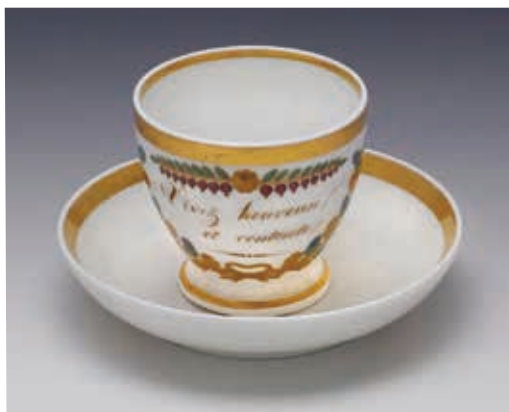
金彩碗皿(個人蔵/当館寄託)