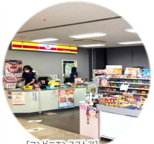
[コンビニエンスストア]

暖かな照明と広々とした空間が特徴。カウンター席も多数あり、一人でゆっくりランチを楽しみたい方にもおすすめです。日替わり定食などの定食、麺類、丼物などメニューが豊富です。お値段もリーズナブルで提供しています。