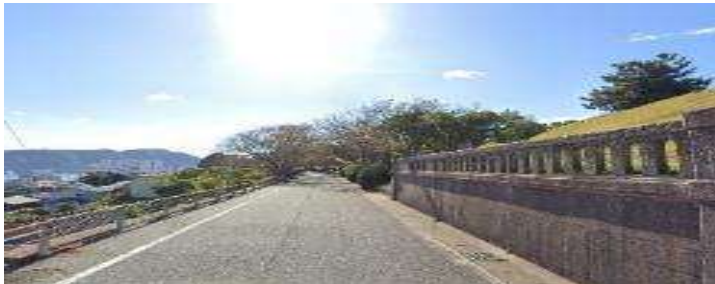
現在の浄水場東側道路