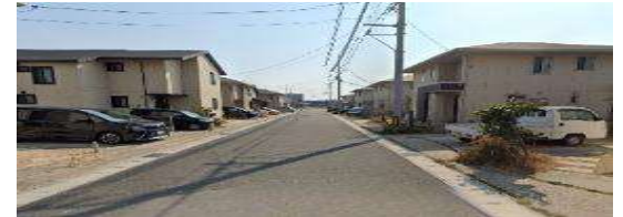
安岡エコタウン地区