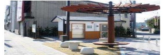
交差点部の交流スペース(イメージ)

※対象とする3つのゾーン以外（北部エリア、寺社とみどり、豊前田通り沿道）については、優先エリアの整備状況を踏まえた上で、各ゾーンに適した利活用の推進を図ります。