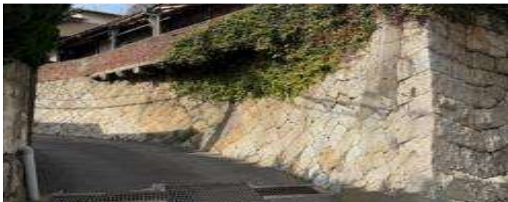
現在の区内道路の景観