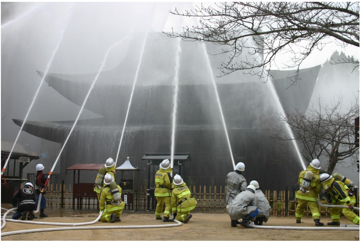
功山寺での消防演習