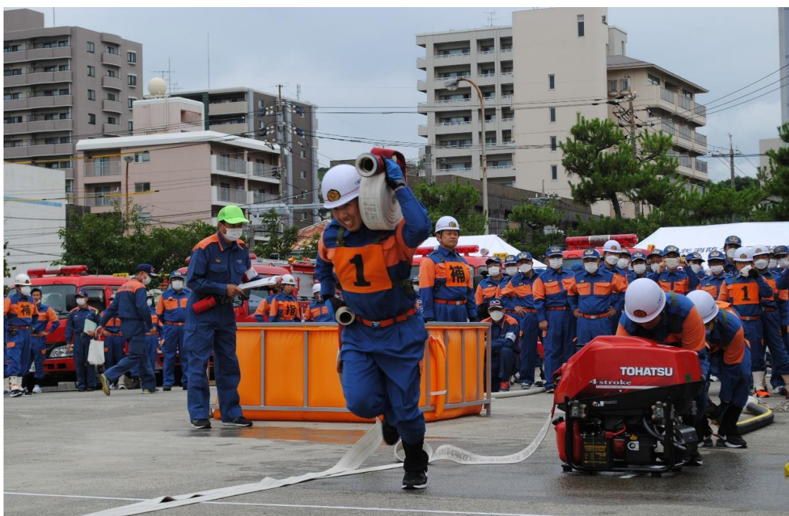
下関市消防操法大会